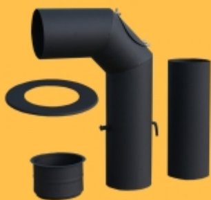
Sada Kouřovodů DN150 černá